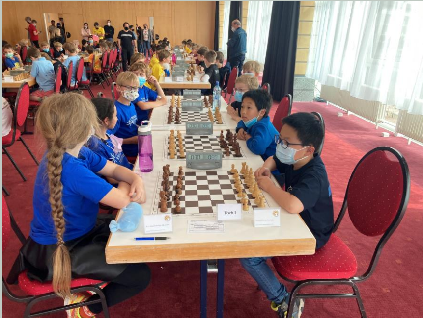
Sonnige Aussichten für Tag 2

Jetzt galt es, nicht übermütig zu werden mit der Tabellenführung im Rücken und sich auf den nächsten Gegner zu konzentrieren. Wir waren froh, dass es nicht die Bremer waren, denn die Kräfte an diesem ersten langen Tag waren nahezu erschöpft. Doch unsere vier Jungs waren noch immer erstaunlich gut drauf und fertigten auch die Düsseldorfer mit 4:0 ab, und nahmen Tabellenführung und zwei Punkte Vorsprung vor Verfolger Pankow mit aus dem ersten Tag.